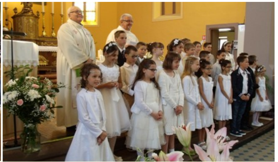
31 Mai 2015: premières communions à Reinhardsmunster